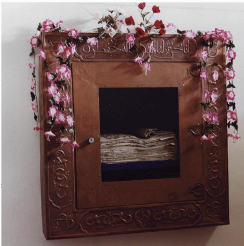
Larawan 2. Ang Mushaf (naisulat na Qur'an) ni Uthman, sa kinalalagyan nitong salamin.