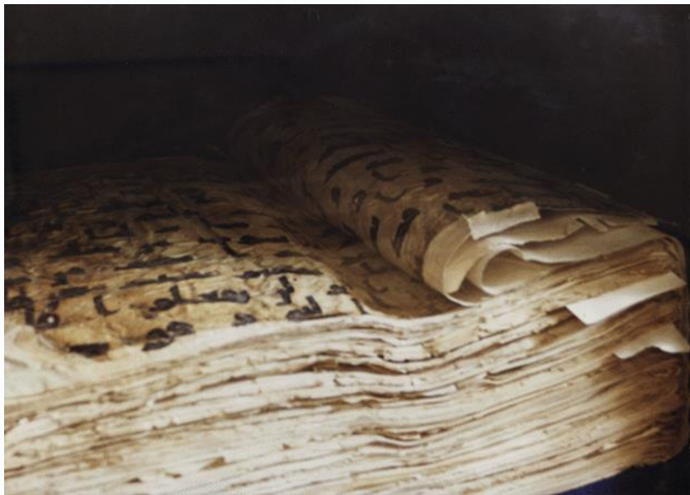
Larawan 1. Ang manuskripto na ito na pinanghahawakan ng lupon ng mga Muslim sa Uzbekistan, ang pinaka-unang naisulat-kamay na Qur'an. Ito ang tiyak na kasulatan na kilala bilang Mushaf ni Uthman na hinahalilihan ang iba pang naisulat pagkatapos.